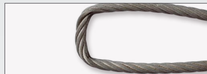
Uszkodzenie w obszarze wsparcia pętli