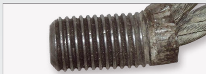
Uszkodzona część gwintowana