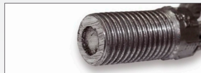
Wysunięcie się linki